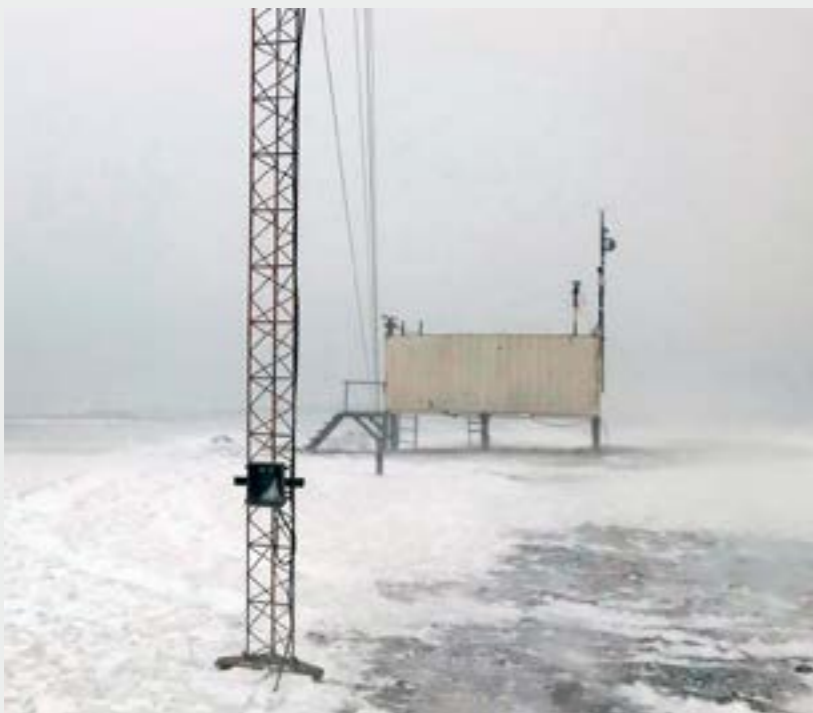
Mittauskontti pienen kävelymatkan päässä asemalta mutta syrjässä aseman päästöiltä. The measurement container in walking distance from the station but safe from station pollution.