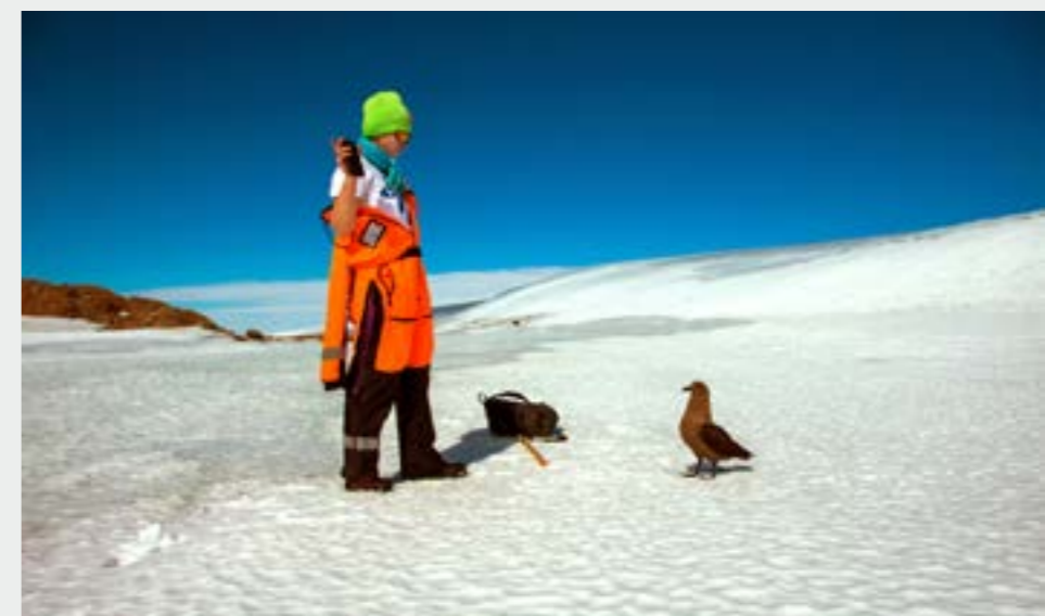
Tutkija valitsemassa mittauspaikkaa Schirmacher Oasiksella. Selection of the proper measuring site at Schirmacher Oasis.