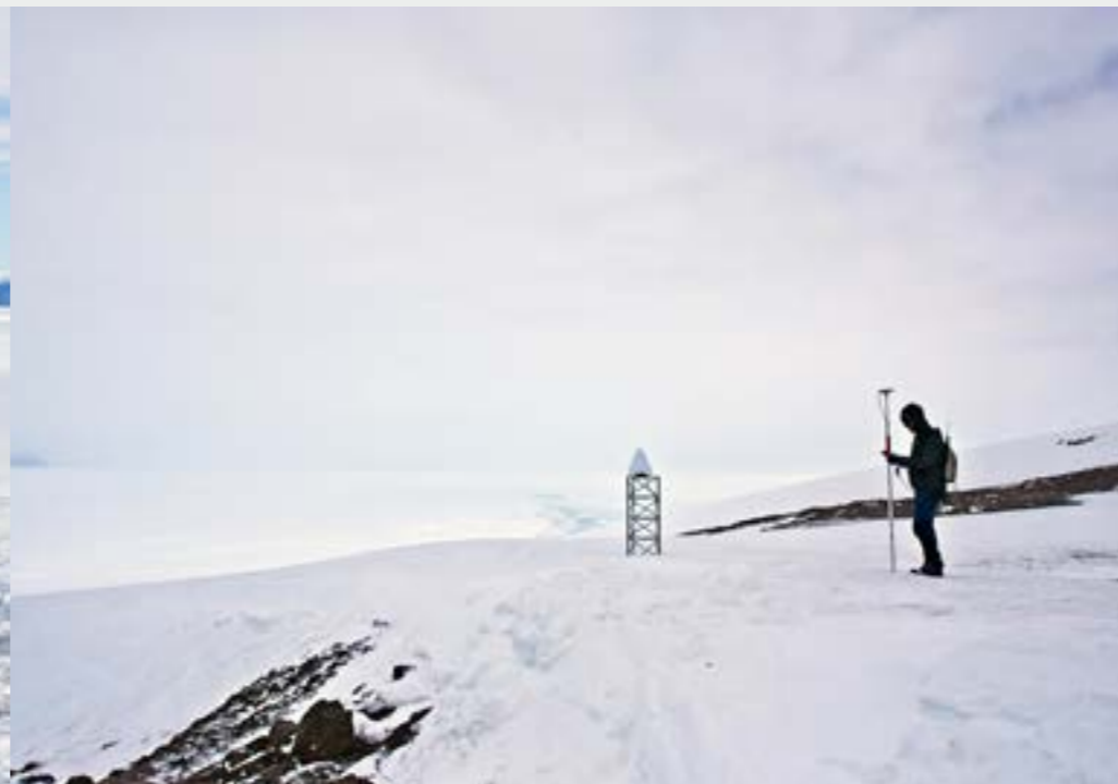
Aseman alueen GPS kartoitusta. Taustalla pysyvän GPS aseman masto. GPS surveying of the station area. In the background, the mast of the permanent GPS station.