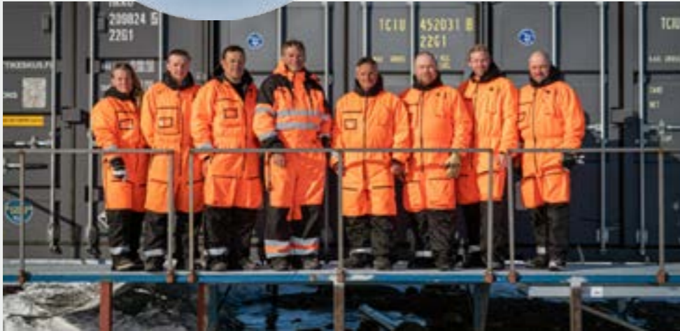
FINNARP 2019 retkikunta. FINNARP 2019 expedition.