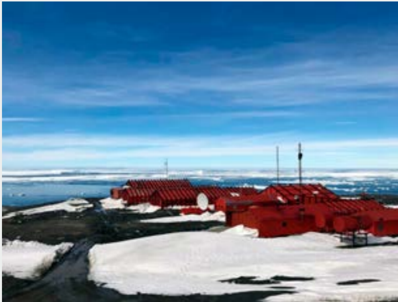
Marambion asema Etelämantereen kesäkaudella. A view from the infrastructure facility of the station.