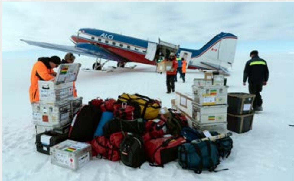
Rahdin purkua Basler BT-67 suksilentokoneesta Basenin jäätiköllä. Offloading cargo from ski-equipped Basler BT-67 on the glacier nearby Basen.

Suomen Etelämanner-tutkimusohjelma FINNARP toteutti vuoden 2019 joulukuun ja vuoden 2020 helmikuun välisenä aikana FINNARP 2019 tutkimusretkikunnan Suomen Etelämanner-asema Aboalle, joka sijaitsee Kuningatar Maudin Maalla. Retkikuntaan osallistui kuusi FINNARP:n työntekijää ja kaksi Maanmittauslaitoksen Paikkatietokeskuksen tutkijaa.