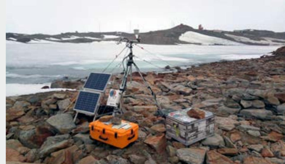
Eddy-covariance mittauksia Glubokoe järven rannalla. The eddy covariance tower deployed on the coast of the Lake Glubokoe.