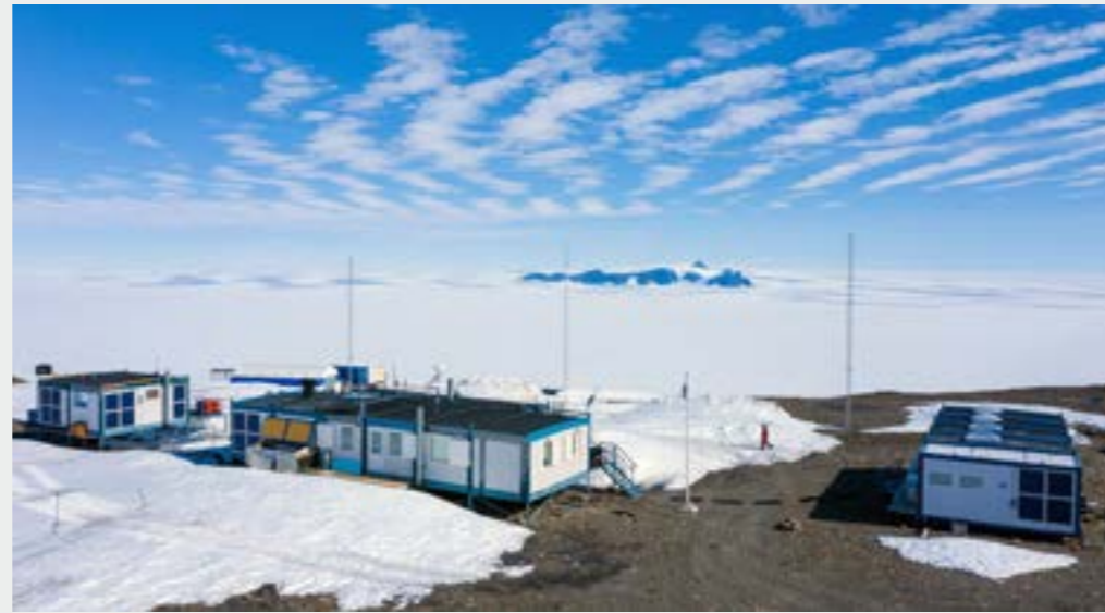
Tutkimusasema Aboa. Research station Aboa.