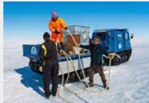
Käyttöveden pumppaus Basenin jäätiköllä. Pumping household water on a glacier nearby Basen.