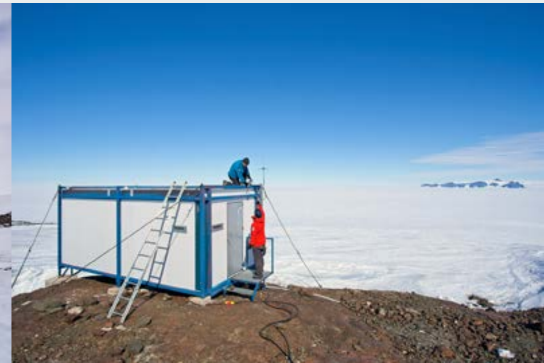
RTK-GPS antennin asennustöitä geokontilla. Installation work of the RTK-GPS antenna at the Geo-container.