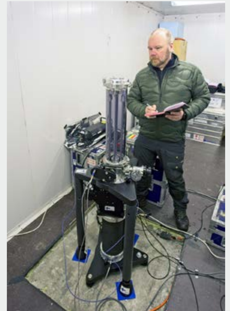
Absoluuttipainovoimamittauksia. Absolute gravity measurements.

All field work was completed according to plan. The research was made within GRAVLASER research project funded by the Academy of Finland.