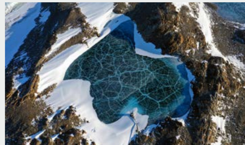
Ilmakuva Verhnee järven valuma-alueesta The aerial image of the snow/ice covered catchment of the Lake Verhnee.