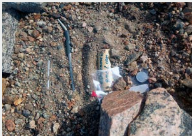
Maaperän lämpötila-antureita. Soil temperature sensors.

Ajanjaksolla 30.11.–21.12.2019 mittausjärjestelmät testattiin ja otettiin käyttöön, ja sen jälkeen Venäjän Etelämannertutkimusohjelma (RAE) jatkoi mittauksia 30.1.2020 saakka. Kenttätyöt tehtiin osana Suomen Akatemian rahoittamaa ASPIRE -projektia (Etelämantereen meteorologia ja lumitutkimus: prosessien ymmärtämisellä parempiin sää- ja ilmastoennusteisiin). Mittauskampanjan toteuttamisesta vastasi Suomen Etelämannertutkimusohjelma yhteistyössä Venäjän Novolazarevskaya ja Intian Maitri -tutkimusasemien kanssa.