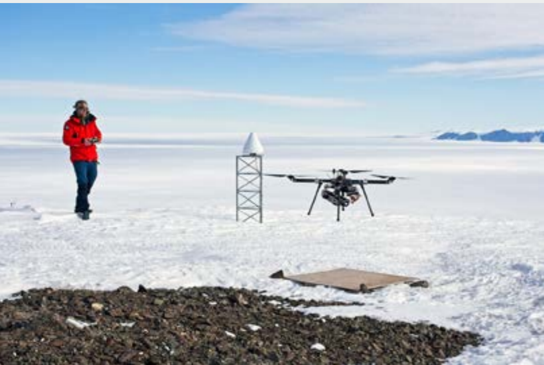
Laserkeilausdronen lennätystä. Flying the laser scanning drone.