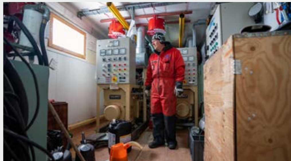
Konemestari mietteisään aseman konehuoneessa. Mechanical engineer in his thoughts at the station engine room.

In January, Swedish Polar Research Secretariat and German Alfred Wegener Institute's polar program completed an over-land traverse to transport supplies from Neumayer III station to nearby Swedish Wasa station. The traverse also pulled a cargo container and fuel to Aboa. On their return to Neumayer III, one FINNARP waste container was pulled to the coast to be shipped to South Africa for processing.