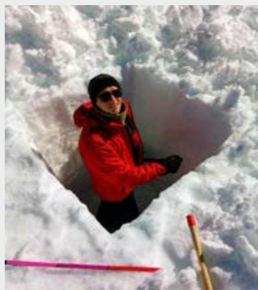
Lumikuoppa kaivettiin lumen lämpötilan ja tiheyden mittauksia varten. Snow pit digging for the temperature and density profile measurements.

During the period of 30.11.–21.12.2019, the measuring systems were tested and deployed on the oases, and then continued until 30.1.2020, supported by the Russian Antarctic Expedition (RAE). The field work was part of the ASPIRE (Antarctic Meteorology and Snow Research: from Process Understanding to Improved Predictions) project, funded by the Academy of Finland. The logistic support was the cooperative effort by the Finnish Antarctic Research Program and the wintering crews of Novolazarevskaya (Russia) and Maitri (India) research stations.